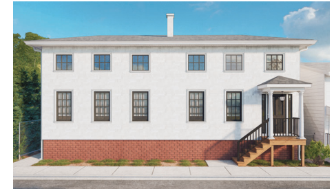
29 Rogers: 4 habitaciones/2 baños • $236,475*