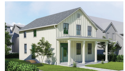
124 Franklin: 3 habitaciones/1.5 baños • $210,066*

*El Precio de Compra en Efectivo depende de varios factores, incluyendo pero no limitado a, la tasa de interés final, la asistencia de pago del enganche de NYS HCR, subsidios adicionales, incluida la deuda de cumplimiento, basada en factores de crédito y debida diligencia, y todo está sujeto a calificaciones y disponibilidad.