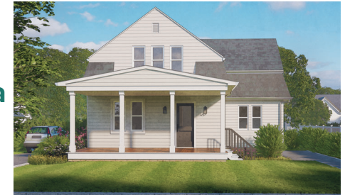
169 Hurley: 3 habitaciones/1 baño • $210,066*

Escanee el código QR o visite KCLB.org/homes para obtener más información y registrarse para nuestra sesión informativa el próximo 24 de octubre a las 6pm . Las inscripciones deben recibirse antes del 8 de noviembre del 2023 . Se aplican límites de tamaño e ingresos del hogar.